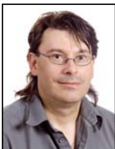
De Jesus Goncalves José Luis Mercedes-Benz Luxembourg