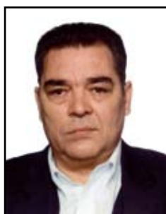
Barroso Vilas Boas Horacio Goodyear Luxembourg Tires