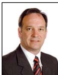
Rota Emile ArcelorMittal - Administration centrale