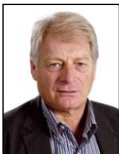
Gales Fernand Fortis Banque Luxembourg