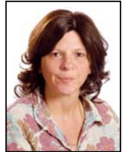
Thomas Marianne Clinique St Louis d'Ettelbruck - Centre Hospitalier du Nord