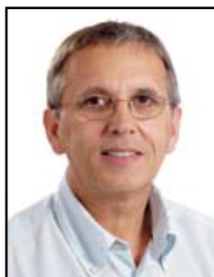
Heirend Claude Fortis Banque Luxembourg