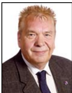
Waldbillig Mathias Autocars Demy-Cars