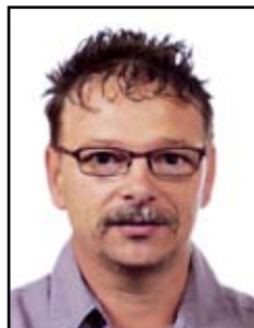
Flick Philippe Goodyear Luxembourg Tires