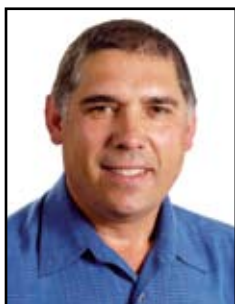
Da Silva Bento Manuel Compagnie de Construction - CDC