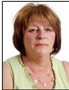
Haentges Suzette Cactus