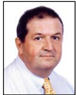
Breuskin Marcel Voyages Ecker