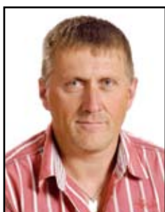
Chevigné Daniel Tarkett GDL