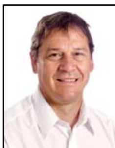
Thill Eric Guardian Luxguard