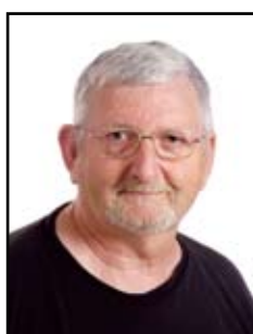
Conrod Claude Movilliat Construction