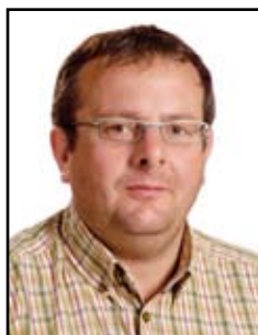
Scholzen Guy Administration des Ponts et Chaussées