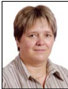
Winter Estelle Pedus Service