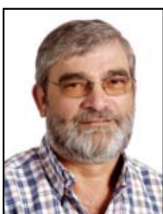
Marques De Paiva Americo Bonaria & Fils