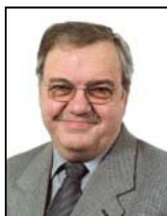
Serres Raymond Goodyear Luxembourg Tires