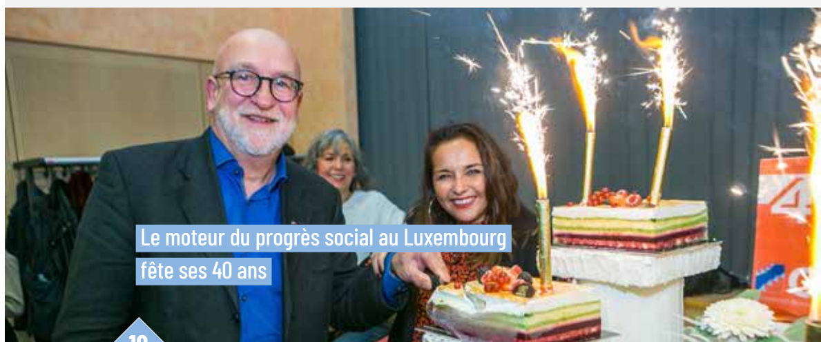
Le moteur du progrès social au Luxembourg fête ses 40 ans