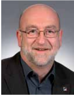
André Roeltgen Generalsekretär des OGBL