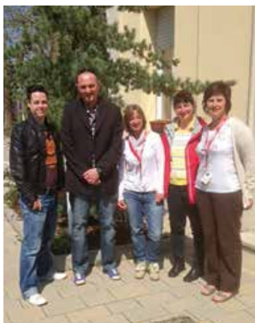
1 re rencontre entre délégués du CHEM et délégués de la Croix Roige 1. Treffen zwischen Personaldelegierten des CHEM und der Croix Rouge

La délégation apprécie cette démarche sans complication qui a permis de centraliser une délégation représentant plus de 1 300 salariés.