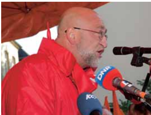
André Roeltgen, OGBL-Generalsekretär, anlässlich der Protestdemo vom 16. September 2010

Darüber hinaus ist der OGBL der Meinung, dass trotz Kompensation für den Verlust der Kinderzulagen und des Bonus über den Weg einer Erhöhung des Gesamtbetrags der Studienbeihilfen auch viele einheimische Familien, insbesondere diejenigen mit kleinem oder mittlerem Einkommen, bei diesem neuen System Verluste hinnehmen müssen.